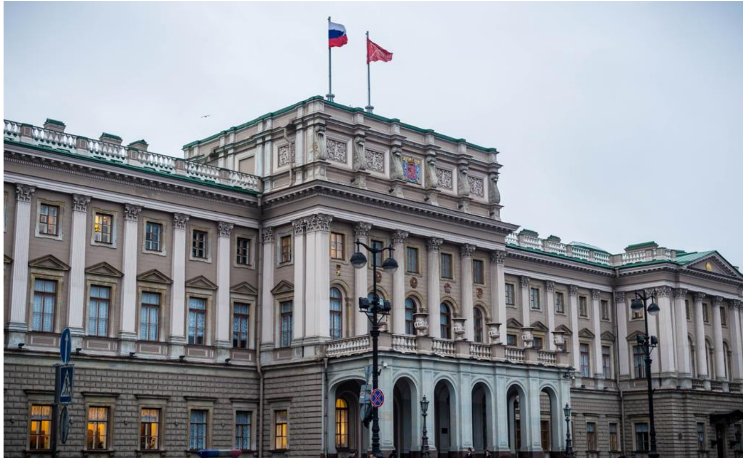
Законодательное собрание Санкт-Петербурга